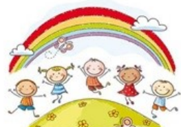
Scuola dell'infanzia di Furato "Don E. Pirovano"

In settimana si conclude l'anno scolastico nelle nostre Scuole dell'Infanzia: a coloro che lavorano a servizio di queste realtà della nostra Comunità un grazie sincero per il bene che seminano.