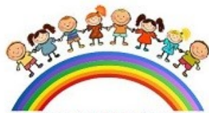
SCUOLA DELL'INFANZIA "DON G. GILARDI" INVERUNO (MI)