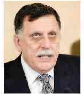
Fayed Sarraj, premier riconosciuto dall'Onu