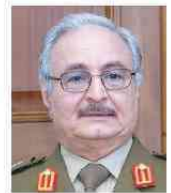
Il generale Haftar, uomo forte della Cirenaica

labrò imprenditore italiano con affari in tutto il mondo considerato un uomo di fiducia dai russi. Al contempo per questo obiettivo è funzionale convincere Haftar a dialogare con Al-Sarraj al fine di conferire maggiore autorevolezza a quest'ultimo, favorendo il cammino segnato dagli accordi di Skhirat. Il tutto con il tacito assenso dell'America.