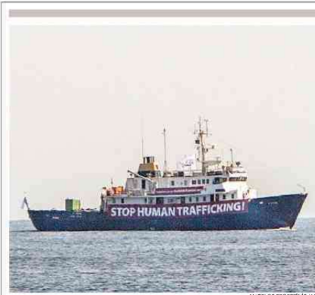
LA C-STAR RIFIUTA GLI AIUTI

Non sono ancora entrato e già mi chiudono in mezzo, dolcemente, come una mano. Ascolto voci, stordito dal caldo e dall'odore che azanna, non sono parole, discorsi singoli, è un mormorio che sale dalla terra. Non sono uomini a parlare, è la disperazione, l'assenza di speranza. «Ci hanno portato via tutto, i poliziotti libici. Denaro, telefonini, vestiti. Non possiamo dire alle nostre fami-